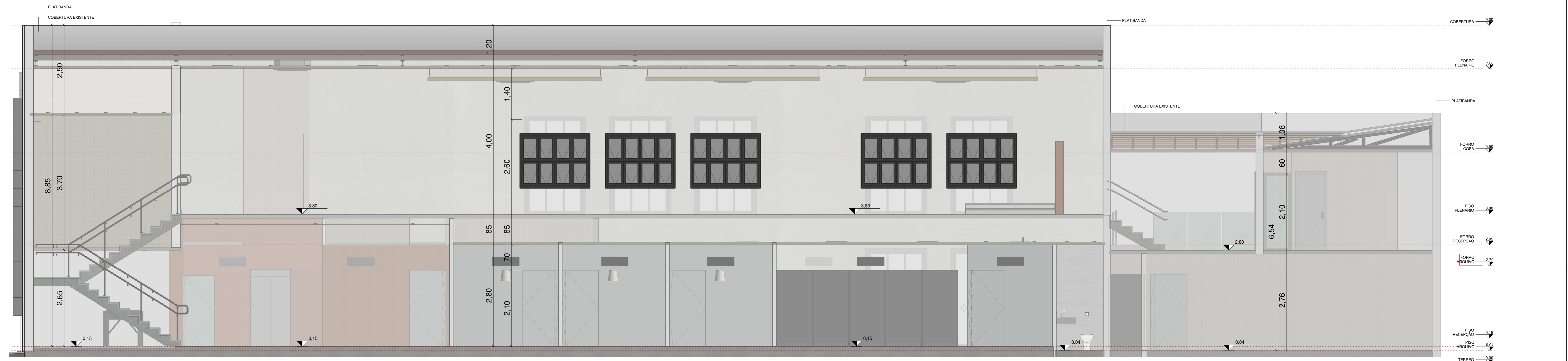
ELEVAÇÃO 04 ESCALA - 1 : 50